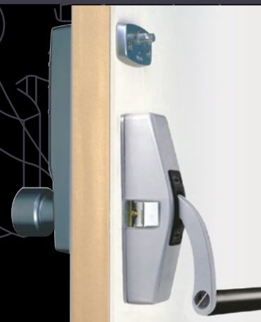
REF. 22103-JPM 89