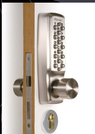
REF. 22103-LOK 50